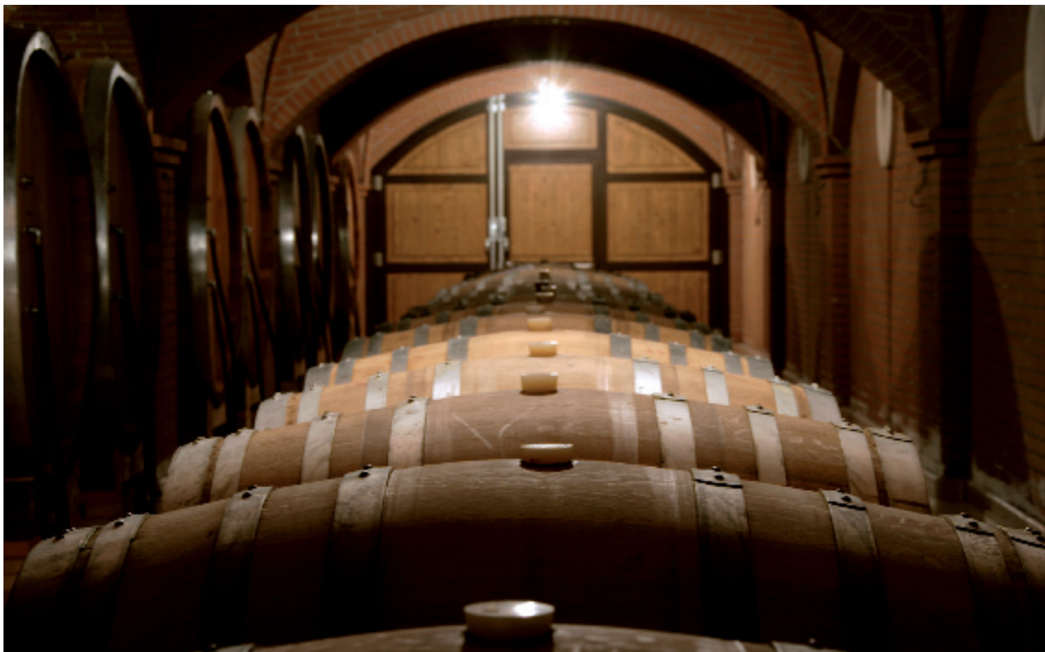
L'ossigeno svolge un ruolo decisivo nell'affinamento dei vini.

vino nella prima fase è di 2,35 mg/l e alla fine del trattamento la concentrazione sale a 4,85 mg/l. Si ha pertanto un arricchimento medio in vasca di 2,50 mg/l.