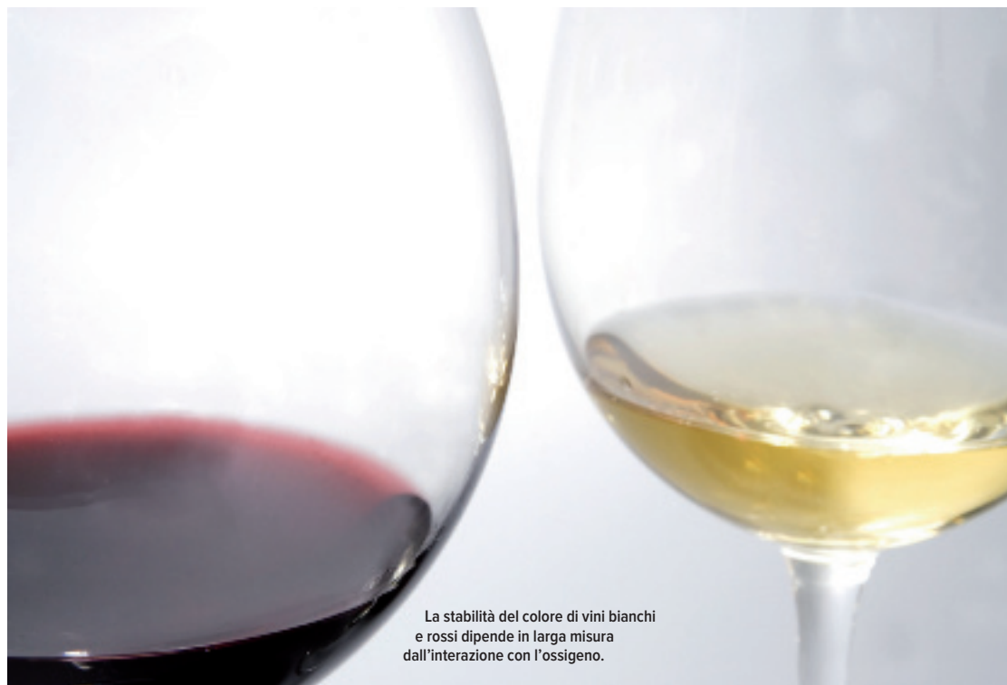
La stabilità del colore di vini bianchi e rossi dipende in larga misura dall'interazione con l'ossigeno.

Vista l'importanza che gioca l'ossigeno nell'evoluzione di un vino, si utilizza la tecnica della microssigenazione per poter controllare tale processo e apportare piccoli volumi di ossigeno al vino per tempi anche molto lunghi. Si possono distinguere due fasi nel processo di microssigenazione: una prima fase di strutturazione e una seconda di armonizzazione. Nella fase di strutturazione avviene la condensazione tannini secchi - antociani liberi attraverso ponti etanale (acetaldeide), comportando un ammorbidimento globale del vino. La conseguenza più evidente di questa condensazione forzata attraverso l'ossigeno risulta essere il fissaggio del colore, in secon-